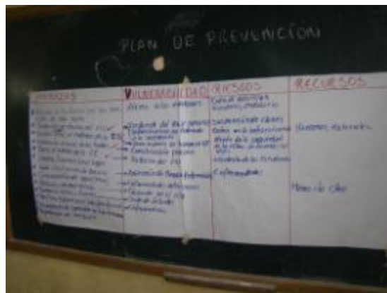
Estudiantes y docentes preparados con el Plan de Emergencia Escolar