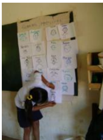
Análisis de las condiciones de contexto y los factores de riesgo