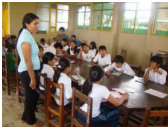
Maestros y estudiantes participando en sesiones de aprendizaje.

El análisis reflexivo ha manifestado por ejemplo diferentes niveles de involucramiento de cada participante, exponiendo cuáles son los actores imprescindibles para el éxito, que las edades de los niños y niñas deben oscilar entre 10 a 15 años, la participación de los maestros, y la junta escolar, de quienes depende el Plan de Emergencia Escolar de forma vital. También ha expuesto que es conveniente para su sostenibilidad la participación del resto de actores. También ha revelado los contenidos que se pueden aglutinar, los tiempos y las secuencias que mejor se articulan y el conjunto de documentos que sirven de base para la aplicación didáctica de los contenidos.