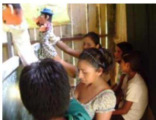
Sesiones educativas en diferentes comunidades que aplican diversas técnicas lúdicas Para el mejor aprendizaje significativo.